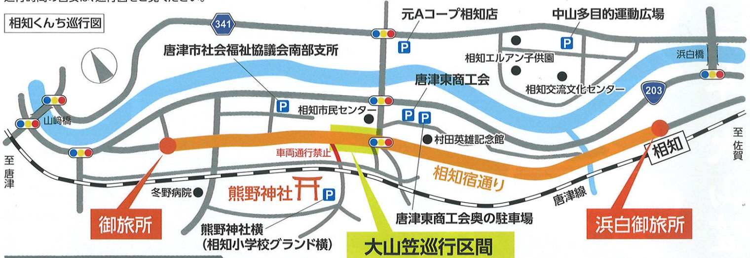
相知くんち巡行図

2台の山笠と1台の大山笠を曳きます。大山笠の高さは10mあります。10mの大山笠は明治期まで曳いていましたが交通の高さ制限により中止されていました。今回、10mの大山笠が復活し曳けることになりました。大山笠が100年の眠りから目を覚ましますので皆様の参加をお待ちしています。巡行時間の目安は、巡行図をご覧ください。