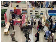
2023年八王子フェスの様子

展示ブースや体験ブースをめぐって全国の日本遺産に出会おう! ブースでは各地の日本遺産にちなんだ名産品などの販売も。