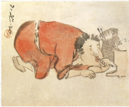
長澤蘆雪「童子火吹」18世紀