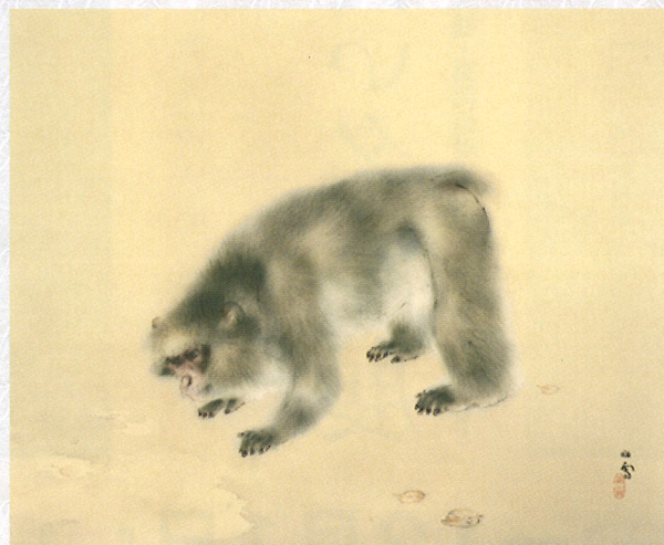
橋本関雪「朝」昭和9年頃