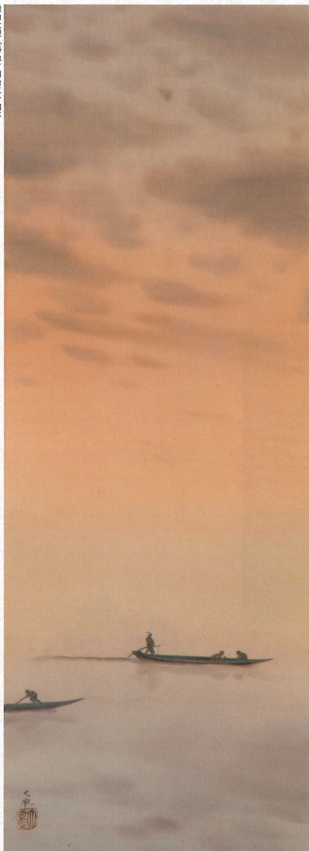
横山大観「帰漁」明治三十四年