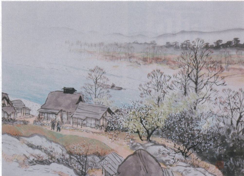
川合玉堂「梅咲くわたし場」昭和26年頃

円山応挙、富岡鉄斎、横山大観、平山郁夫など、「名前はどこかで聞いたことがある。」人たちの名品がそろってきますので、この機会にぜひご来館ください。