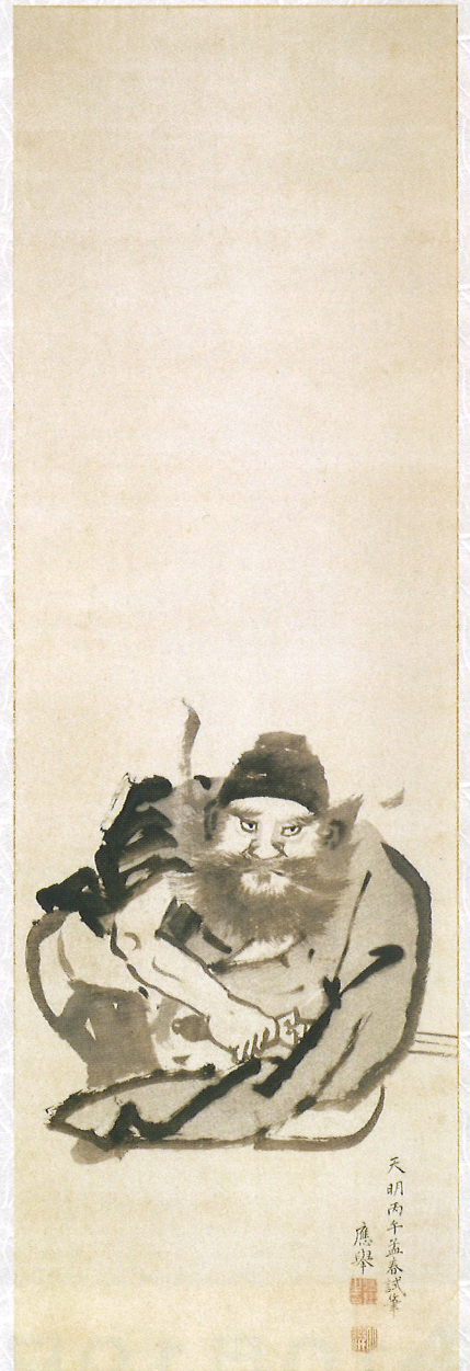
円山応挙「鍾馗図」天明6年