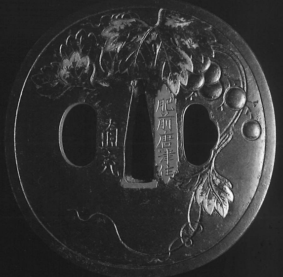
葡萄図鐺 直充作 (佐賀県立博物館・美術館 所蔵)