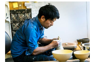
ぶんそうがま 文三窯 (三宅製陶所)

〒848-0025 佐賀県伊万里市大川内町1820 ☎ 0955-23-2784